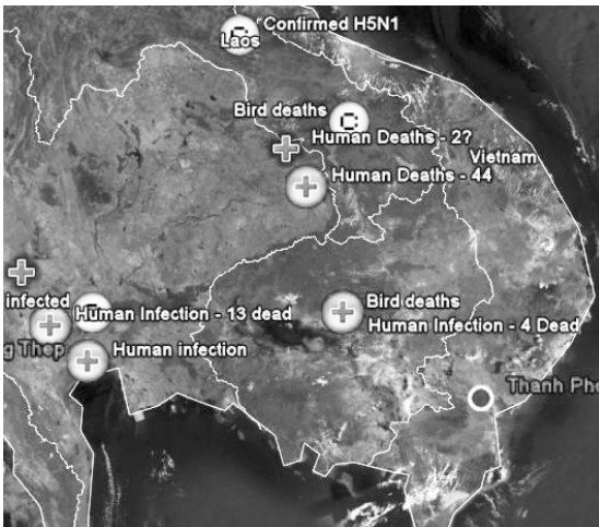
Rys. 4. Przygotowana dzięki KML mapa zagrożeń wirusem H5N1.

Do lepszego opisu lokalizowania obiektów w serwisie Google Earth posłużył KML, oparty oczywiście na XML-u. KML, czyli Keyhole Markup Language , to język znaczników do opisu danych geograficznych, które mają być wyświetlane w programie Google Earth. W kodzie pliku kml można podać miejsce geograficzne (długość i szerokość geograficzną), stopień przybliżenia obiektu (można przyrównać do wysokości, z jakiej oglądamy obiekt), a nawet kąt, pod którym będzie prezentowana wizualizacja obiektu. Jeśli ktokolwiek, kto ma w systemie zainstalowany program Google Earth, otworzy plik kml lub kmz, zawartość kodu zapisana do pliku będzie analizowana przez aplikację i, zgodnie z zapisami w pliku, wyświetlony będzie obraz przedstawiający konkretne miejsce geograficzne. Pod adresem, www.wszop.edu.pl/informatyka/wszop.kml można pobrać plik, który przedstawia budynek Wyższej Szkoły Zarządzania Ochroną Pracy w Katowicach i jego najbliższe otoczenie (plik należy zapisać na dysk i uruchomić). Język KML to nie tylko możliwość wskazywania miejsc geograficznych, to także możliwość wyznaczania tras między obiektami, opisywania zjawisk zachodzących na naszym globie – np. rejony występowania wirusa H5N1 (rys. 4) czy skutki skażenia po katastrofie w Czarnobylu.